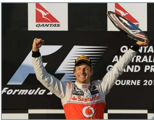
Pilotul britanic Jenson Button (McLaren-Mercedes) s-a impus, ieri, în Marele Premiu al Australiei, prima etapă a

sia, mâine, pe terenul lui Greuther Furth (primul loc în liga secundă), iar Bayern, miercuri, de asemenea în deplasare, contra revelației Monchengladbach.