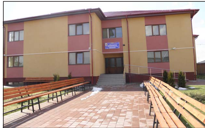
O bunăstare care vine din trudă

asfaltate și iluminate, cu o școală modernă în care învață 500 de copii și o grădiniță cu program prelungit la care merg aproximativ 160 de copii, un stadion cu nocturnă și spații verzi minuoș amenajate, localnicilor nu le lipsește nimic ca să trăiască în condițiile asigurate de un centru urban. Deteriorate de la lucrările întreprinse în ultimii ani pentru construirea rețelilor de apă și de gaze, dar și pentru canalizare, pe unele tronsoane asfaltul s-a deteriorat, determinând autoritățile să intervină pentru a reface infrastructura pe acele porțiuni de drum. Pe zi ce trece, prin eforturile autorităților locale, Ișalnița ia imaginea unei localități preocupate de viitorul tinerei generații, căreia i se oferă șansa unei educații comparabile cu cea din zona urbană, iar roadele eforturilor sunt vizibile.