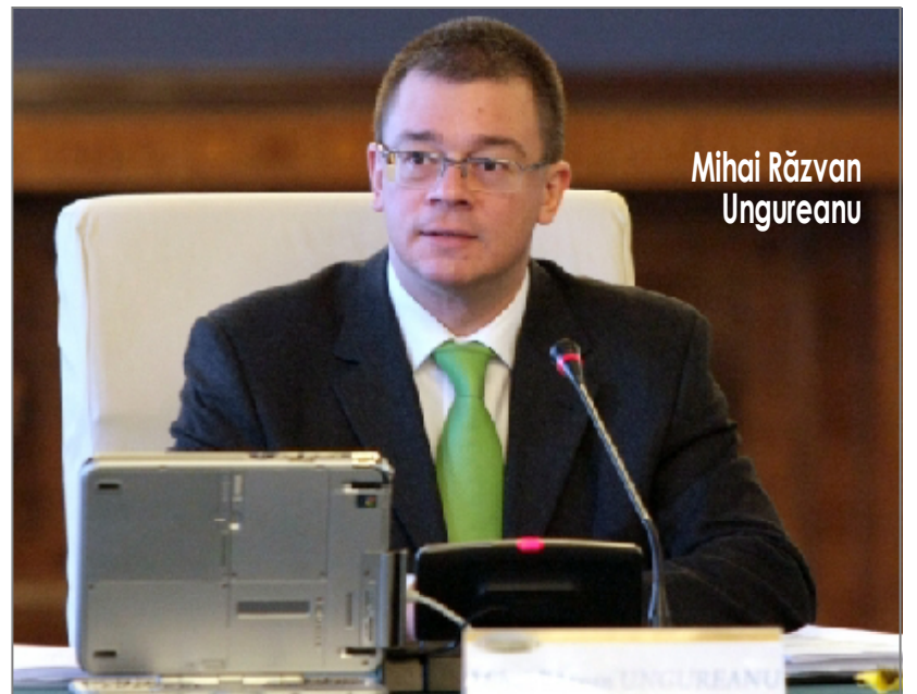
Mihai Răzvan Ungureanu

Prin scrisoarea deschisă către premierul Mihai Răzvan Ungureanu, Victor Ponta a mai anunțat încă o dată că USL își rezervă dreptul de a folosi orice mijloc legal pentru a sancționa un astfel de derapaj, fiind dispusă să meargă până la depunerea de plângeri penale împotriva celor responsabili, făcând din nou apel la acesta să nu aplice aceleași metode ca fostul prim-minis-