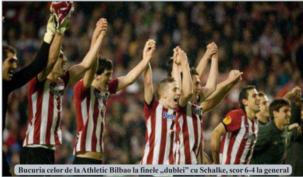
Bucuria celor de la Athletic Bilbao la finele „dublei” cu Schalke, scor 6-4 la general

Partea secundă a început în aceeași notă, dar cu infinit mai mult succes pe tabelă! A