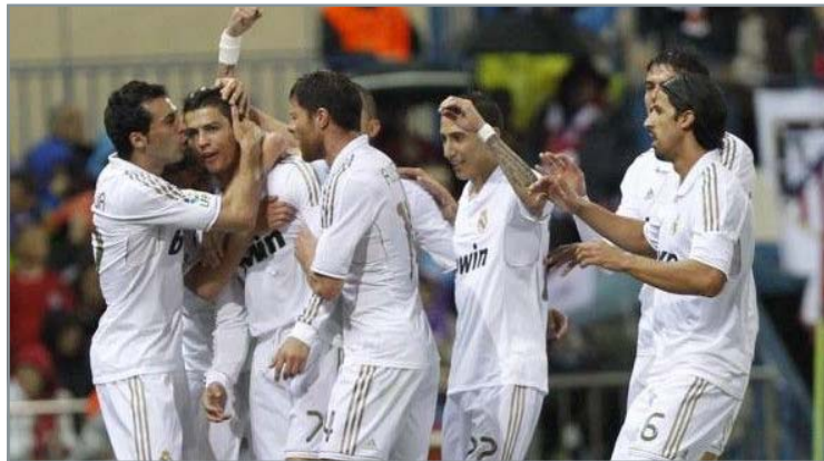
(a), iar Barcelona (78p) cu Levante (d), Real Madrid (a), Rayo Vallecano (d), Malaga (a), Espanyol (a) și Betis Sevilla (d).

Cu 6 etape rămase, incluzând aici și meciul direct de pe "Camp Nou" (21 aprilie), Real Madrid (82p) mai are de jucat, în ordine cu Sporting Gijon (a), FC Barcelona (d), FC Sevilla (a), Athletic Bilbao (d), Granada (d) și Real Mallorca