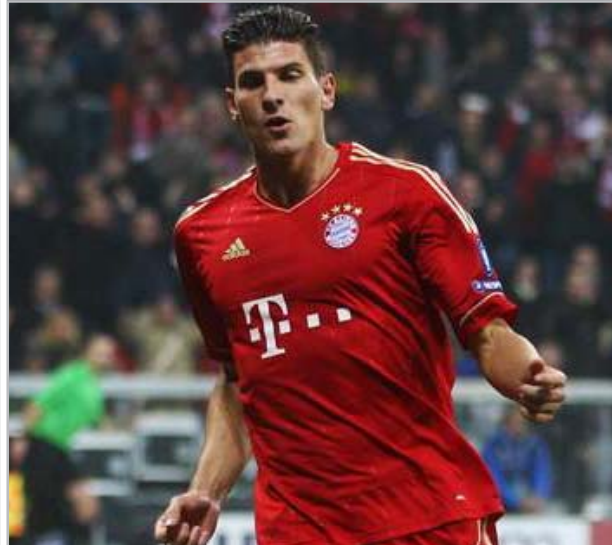
Ei sunt principalii realizatori ai celor două echipe în Ligă: Cr. Ronaldo (8 reușite – foto stânga) și Mario Gomez (12 reușite – foto dreapta)

Euforia victoriei împotriva celor de la Barcelona a trecut și Madridul freamătă în așteptarea orei de start a meciului cu Bayern Munchen. Un meci cât o finală pare să fie deviza celor de la Real care nu concep să nu ajungă în ultimul act al competiției, după o pauză de un deceniu. Deși favoriți în ciuda înfrângerii din tur (1-2), "galacticii" lui Jose Mourinho nu le va fi însă deloc ușor. Cel puțin așa spune tradiția!