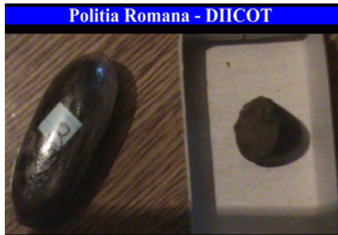
Politia Romana - DIICOT

Polițiștii Serviciului Antidrog din cadrul Brigăzii de Combatere a Criminalității Organizate (BCCO) Craiova, cu sprijinul po-