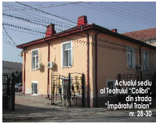
Actualul sediu al Teatrului „Colibri”, din strada „Împăratul Traian” nr. 28-30