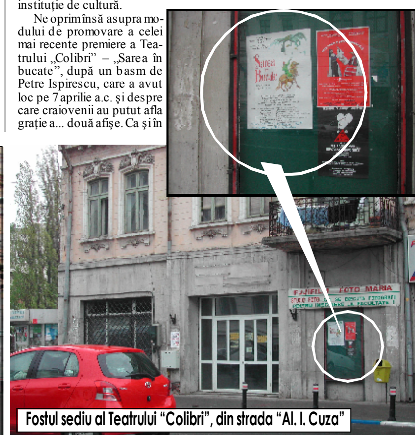
Fostul sediu al Teatrului „Colibri”, din strada „Al. I. Cuza”