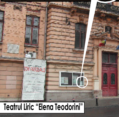
Teatrul Liric „Elena Teodorini”