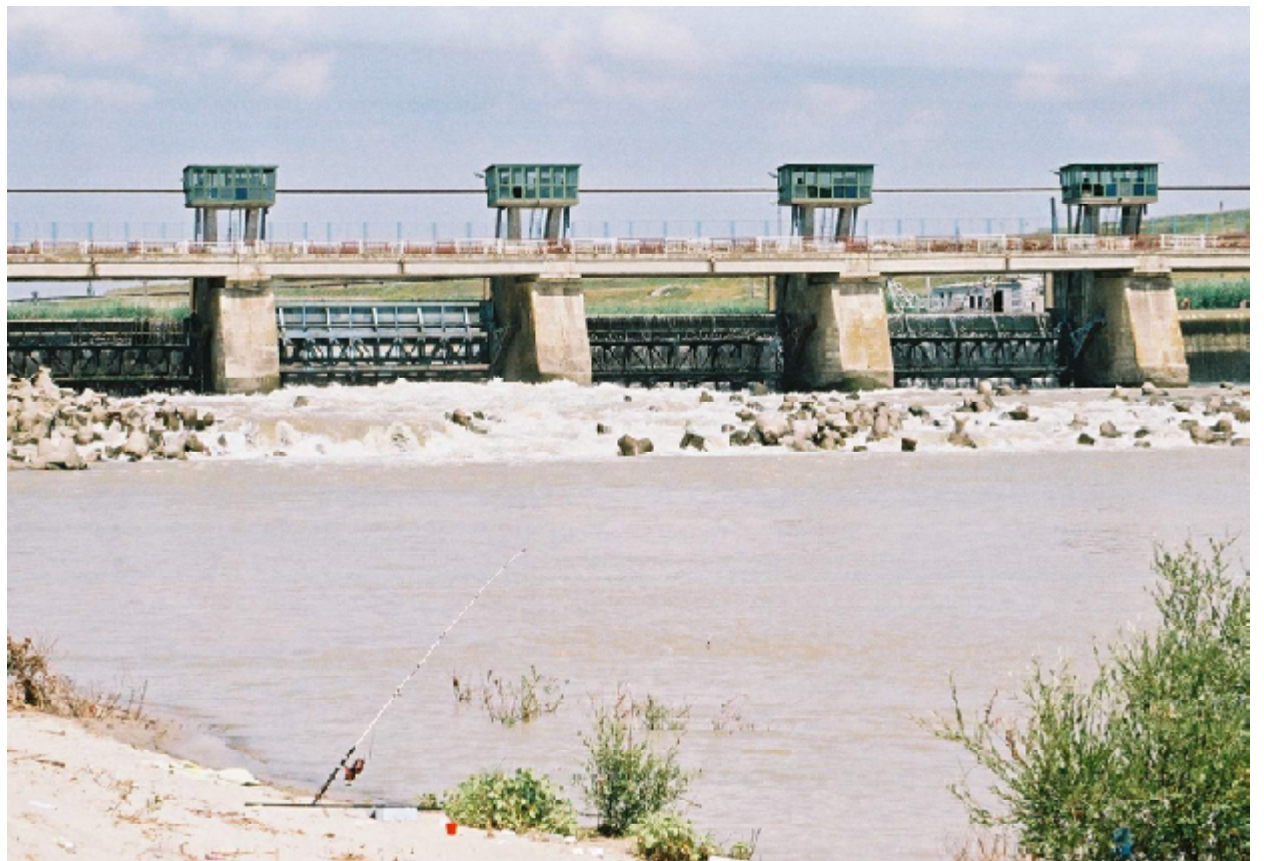
ne a anunțat că menține avertizarea de cod galben pe Jiu, amonte Filiași, și pe afluenții săi.

Ieri, la ora 7.00, cota Jiului era de 430 cm, puțin peste limita normală, tendința era de scădere, iar la ora 12.00 nivelul coborâse la 374 cm. De asemenea, la Podari, cota înregistrată la ora 12.00 era de 304 cm, cu o tendință de creștere, dar fără depășirea cotelor de inundație, conform prognozelor hidrologice. Cu toate acestea, Administrația Națională Apele Româ-