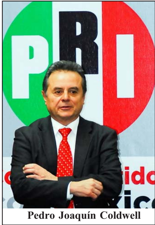
Pedro Joaquín Coldwell

tare și posibila asociere cu firme private străine. Apoi, cotația la bursă, cum s-a întâmplat cu antrepriza braziliană Petrobras, citată ca exemplu. Potrivit lui Arnulfo Valdivia, singura țară cu un cadru juridic atât de restrictiv în domeniul este Coreea de Nord. Mexicul nu are capacitatea economică și nici tehnologică pentru modernizarea exploatarea sale de petrol și gaze naturale. Un alt subiect sensibil este nesiguranța. PRI încearcă să „concentreze forțele armate în cele 27 de municipalități unde au loc 85% din omucidările legate de crima organizată”. De asemenea, dorește să crească efectivele agențiilor poliției federale, de la 36.000 la 50.000, și să o transforme în jandarmerie națională. Cooperarea cu SUA va fi mult mai transparentă. Narcotraficul nu este, pentru mexicani, principala preocupare, dar trebuie pus capăt răpirilor, extorcărilor, traficului de fințe vii, violurilor, care n-au reținut atenția necesară autorităților. În fine, o negociere pentru stoparea escaladării violențelor este imposibilă, din cauza multitudinii carturilor drogurilor și a bandelor de crimă organizată.