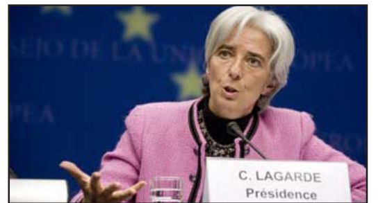
C. LAGARDE Présidence

Văzând reacția furioasă a grecilor, directorul general al FMI și-a nuanțat, duminică, pe pagina sa de Facebook, afirmațiile făcute în interviu, susținând că, „așa cum am spus de multe ori, sunt foarte înțelegătoare cu poporul grec și cu problemele cu care se confruntă”. „Acesta este motivul pentru care FMI sprijină Grecia în efortul său de a depăși criza actuală și de a reveni pe calea creșterii și stabilității economice”, a adăugat Lagarde, precizând că „fiecare trebuie să contribuie la acest efort, în special cei mai privilegiați, și fiecare trebuie să-și plătească impozitele”. Peste 10.000 de comentarii, scrise într-un stil mai mult sau mai puțin agresiv, au răspuns, de duminică, mesajului de conciliere.