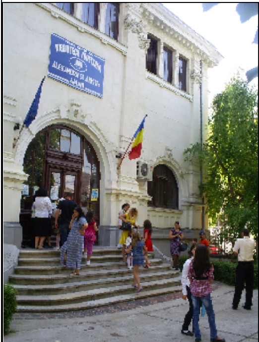
Biblioteca Județeană „Alexandru și Arista Aman” inițiază, pe perioada vacanței de vară, în cadrul celei de-a IV-a ediții a proiectului

„Biblioteca din vacanță”, un program educativ destinat copiilor și adolescenților. Astfel, în perioada 1 iulie – 31 august, se vor desfășura săptămânal diferite ateliere, pe categorii de vârstă. Elevii din clasele a II-a – a IV-a pot participa la ateliere de limbile engleză, spaniolă și italiană, de desen, lucru manual și origami, iar cei din clasele a V-a – a VIII-a – la ateliere de teatru și oratoric (public speaking).