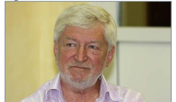
Un călător împătimit în universul teatral și cinematografic, Eusebiu Ștefănescu a marcat timp de 16 ani existența Teatrului „Toma Caragiu” din Ploiești, apoi a poposit o vreme la Teatrul Mic. În cele din urmă și-a clădit „casa” la Naționalul bucureștean. De regizorul Geo Saizescu îl leagă o prietenie îndelungată...