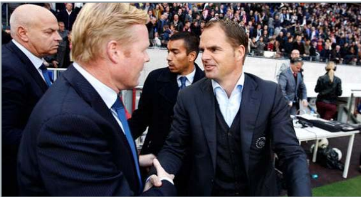
Ronald Koeman (foto stânga), Frank de Boer (foto dreapta)

Joi, De Telegraaf a realizat un sondaj pe propriul site. Subiectul: cine ar fi cel mai bun selecționer. Preferatul internaților a fost Louis van Gaal (24%), chiar dacă acesta nu a calificat Olanda la CM 2002. Frank de Boer și Ronald Koeman favoriții federației, s-au clasat doar pe locurile 8 și 9, cu 5, respectiv 4 procente.