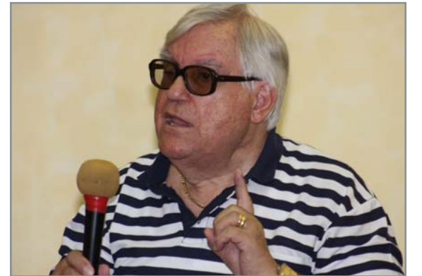
Regizorul, scenaristul și actorul Geo Saizescu este originar din Prisăceava Mehedințului, iar pe 14 noiembrie a.c. va împlini 80 de ani.