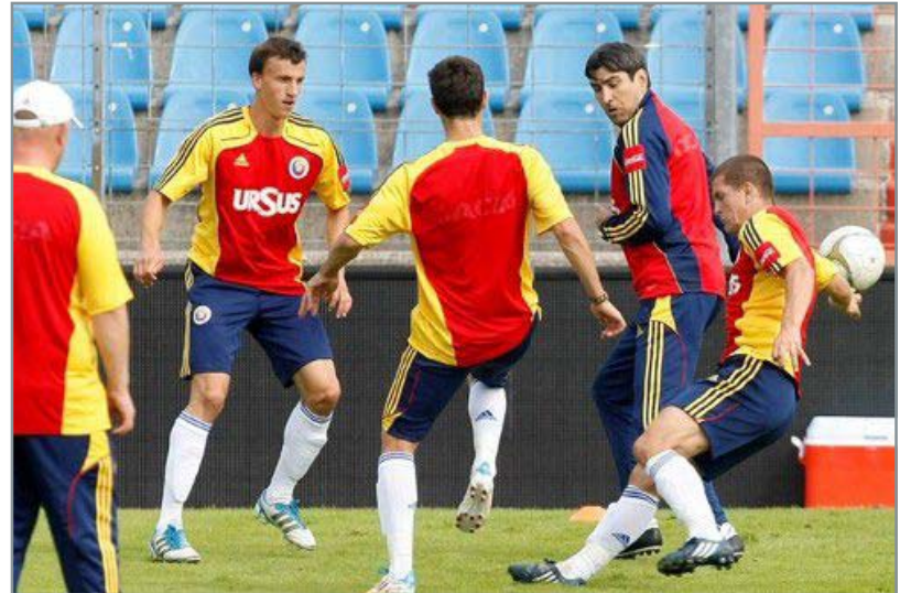
a fost "radiografia" făcută ieri de seleționer.