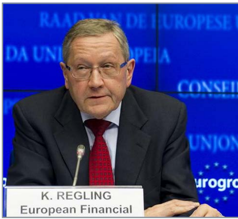
K. REGLING European Financial

țional, în luna octombrie a acestui an”, a explicat Regling. În valoare de 500 de miliarde de euro, acest mecanism, care va înlocui FESF, va putea să recapitalizeze direct băncile și să cumpere obligațiuni pe piața secundară. Inițial, MES ar fi trebuit să intre în vigoare în iulie, dar legea nu a fost încă ratificată de țări mari, precum Germania, Italia și Spania. În Germania, Curtea Constituțională trebuie să se exprime asupra acestei probleme pe 12 septembrie, în urma mai multor contestații, în special din partea stângii radicale. Decizia poate determina, în opinia unor analiști, supraviețuirea sau nu a monedei unice, în condițiile în care MES nu poate fi privat de principalul său contribu-