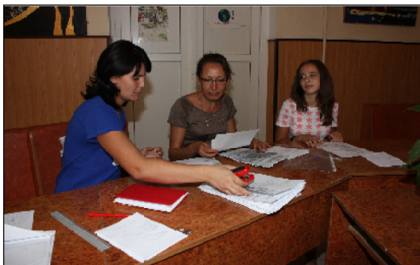
Înscrierile la cursuri continuă și se pot face zilnic, între orele 9.00 și 16.00, la sediul instituției

Înscrieri se mai fac până spre sfârșitul lunii și, până când va fi pus la punct site-ul instituției, solicitații sunt așteptate la sediu, unde vor primi și vor completa o cerere-tip, căreia îi vor atașa o copie după certificatul de naștere ori cartea de identitate. «Intenționăm să postăm cererea și pe site-ul nostru, pe care îl vom „revigora” în curând, pentru ca părinții să aibă po-