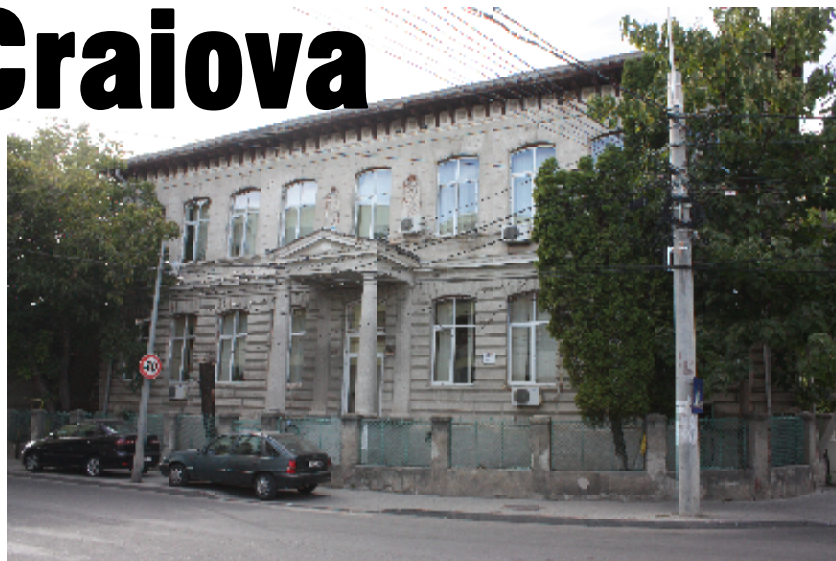
Palatul Copiilor din Craiova este situat pe strada „Simion Bărnuțiu” nr. 20 (tel./fax: 0251.534.511)