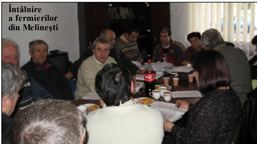
Întâlnire a fermierilor din Melinești