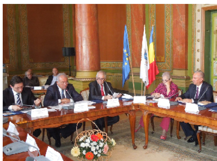
Simpozionul „Oltenia Turistică – necesități, premize, oportunități” a fost organizat în cadrul manifestărilor prilejuate de Săptămâna Turismului Gorjean și s-a bucurat de prezența prefectilor și a președinților de consilii județene din Regiunea de Dezvoltare Sud-Vest Oltenia.

aveau obiceiul să-și administreze o moșie în Câmpia Băleștiului, să realizeze o casă impunătoare și să-și trimită copiii în studiu la Paris. Visez la o zi în care toate aceste case să le vedem reabilitate așa cum sunt cele de la Bruges. În