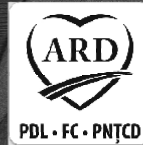
Doru Safta, candidat pentru colegiul 10 Camera Deputaților