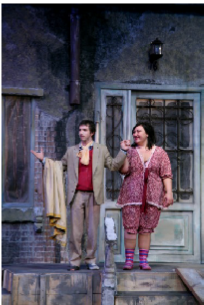
„O noapte furtunoasă”, de I. L. Caragiale, regia Mircea Cornișteanu

soare pierdută”, „Tartuffe”, „Grăsana” ș.a. Ce roluri le vei adăuga în 2013? Și care îți sunt, în general, proiectele pentru acest an?