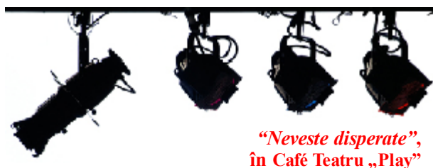
„Neveste disperate”, în Café Teatru „Play”

- Nu! Nu-mi place Bucureștiul deloc, absolut deloc. Nu că ar avea ceva orașul, dar nu mă simt eu bine, nu mă regăsesc acolo. Și cred că iubesc și foarte mult Craiova. La un moment dat, când am terminat facultatea, mă gândeam să mă duc în Ardeal, îmi plăcea foarte mult