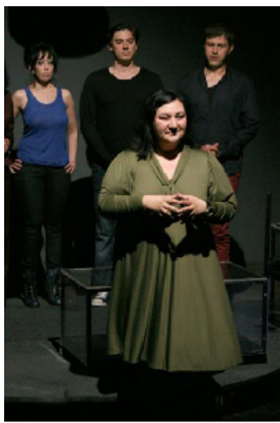
„Photoshop”, de Catinca Drăgănescu, regia Catinca Drăgănescu

Clujul. Dar acum... Îmi place Craiova. Îmi place efervescența de aici, oamenii se înjură pe la semafoare, se ceartă, vorbește repede... Mie îmi place. Și Bucureștiul le la fel, dar, pe de altă parte, mi se pare că te anulează ca persoană.