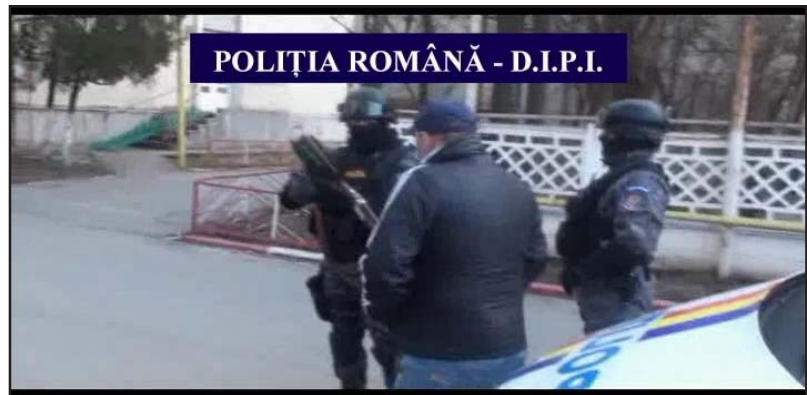
POLIȚIA ROMÂNĂ - D.I.P.I.

de a le comercializa pe piața neagră din Craiova, au fost reținuți pentru 24 de ore, sâmbătă după-amiază, iar ieri au fost prezentați Tribunalului Dolj cu propunere de arestare preventivă. Țigaretile capturate, autoturismul cu care le transportau, dar și pachetele ridicate în urma perchezițiilor efectuate la locuințele suspectilor, au fost confiscate.