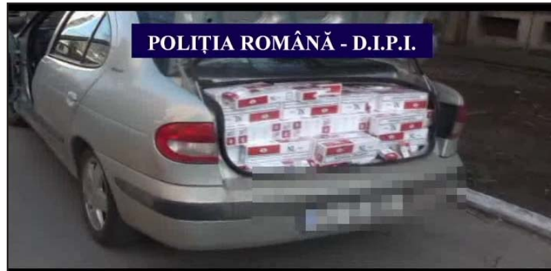
POLIȚIA ROMÂNĂ - D.I.P.I.