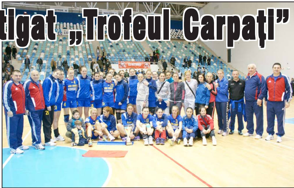
Clasamentul final: 1. România A 5p, (golaveraj plus 16), 2. Germania 5p (golaveraj plus 7), 3. Spania 1p (golaveraj minus 10), 4. România B (golaveraj minus 13).