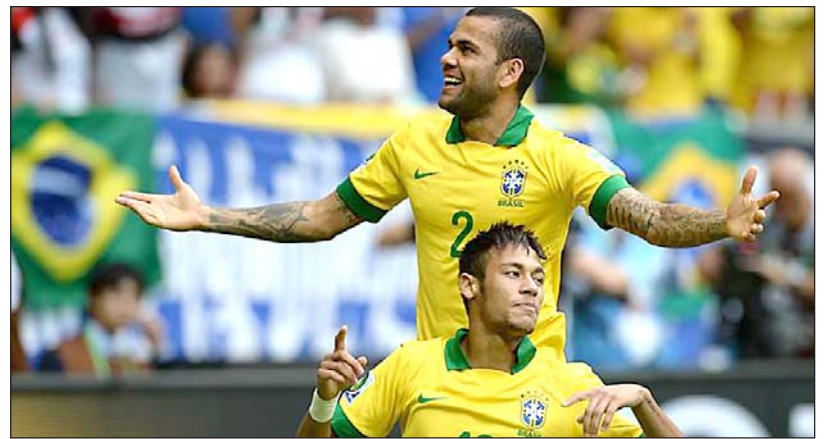
Uruguayul. Prima rundă a fazei grupelor se va încheia diseară (22:00, o oră mai târziu înregist-

Cealaltă dispută a grupei A a adus față în față, a seară târziu (ora 22:00), reprezentativele Mexicului și Italiei. Ulterior (ora 1:00) a debutat și grupa B, Spania înfruntând, într-un veritabil derby,