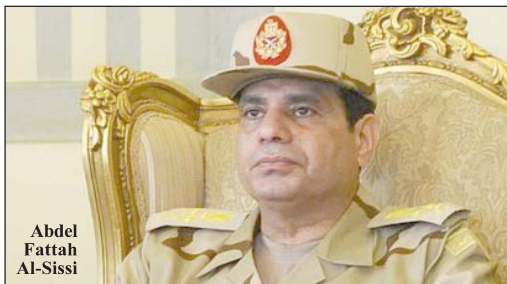
Abdel Fattah Al-Sissi

pentru Pace Mohammed ElBaradei sau fostul lider al Ligii Arabe, Amr Moussa – numele lui Adly Mansour nu a apărut niciodată printre potențialii succesori ai lui Morsi. Acest anonim relativ i-a interesat probabil pe militarii dornici să avanseze o figură neutră pentru a asigura tranziția, care se anunță dificilă. Judecătorul Adly Mansour a depus ieri jurământul în calitate de președinte interimar al Egiptului, ceremonia fiind difuzată în direct de televiziunea egipteană. „Mă angajez să păstrez sistemul Republicii, să respect Constituția și legea și să apăr interesele poporului”, a declarat Mansour la investire. Imediat după anunțul privind demiterea lui Morsi, armata a preluat controlul instituțiilor-cheie din Egipt și a mobilizat blindate pe străzile principalelor orașe, argumentând că, altfel, sutele de mii de manifestații l-ar fi omorât de Morsi. Liderul opoziției egiptene, Mohamed ElBaradei, împreună cu clerici religioși musulmani și creștini, vor prezenta, cu aprobarea armatei, „o foa-