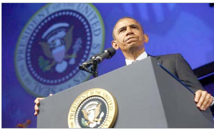
Obama, autorizat „să utilizeze forțele armate” ale SUA „cum consideră el necesar și potrivit”

Dezbaterile din Congresu vor începe luni, 9 septembrie, au anunțat, sâmbătă, responsabili republicani din Camera Reprezentanților, conform AFP. „Suntem mulțumiți că președintele a solicitat o autorizație (din partea Congresului) pentru o intervenție militară în Siria”, a declarat John Boehner, președintele Camerei Reprezentanților, dar și alți parlamentari republicani, într-un comunicat. Și „Senatul se va angaja imediat în această dezbateră crucială, prin audieri publice și reuniuni de informare pentru senatori, săptămâna viitoare”, a dat asigurări, la rândul său, liderul democraților în Senat, Harry Reid, citat într-un comunicat. Audierile vor fi organizate de Comisia de Politică Externă din Camera superioară a Congresului, iar la ele vor participa oficiali de rang înalt din cadrul administrației.