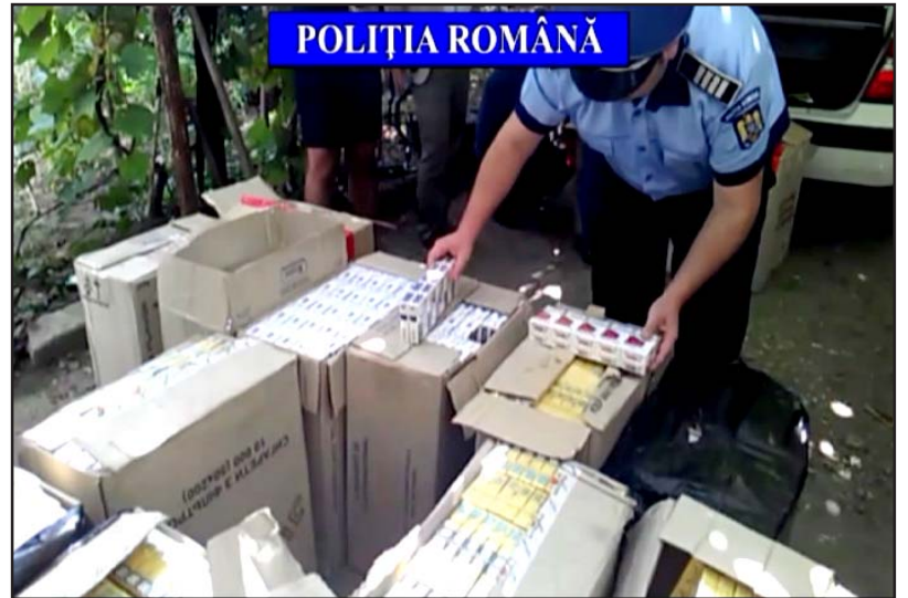
aspectul comiterii infracțiunii de deținerea de către orice

„În cauză, polițiștii au întocmit acte premergătoare începerii urmăririi penale sub