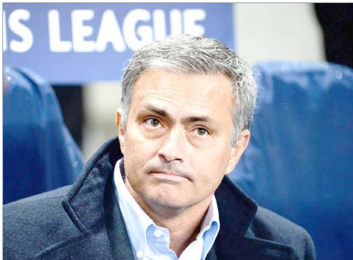
Liga Campionilor”, a spus Mourinho.

“Am văzut în ultimele meciuri din Liga Campionilor că există o cultură a trîșorilor și nu înțeleg de ce nu sunt penalizați. Am văzut episoadele cu Neymar la Glasgow și cu Balotelli la Amsterdam. O echipă a rămas în zece jucători (n.r. - Scott Brown de la Celtic Glasgow a fost eliminat după un fault la Neymar), iar alta a fost penalizată cu penalty în ultimele minute (n.r. - Mario Balotelli a obținut un penalty în finalul jocului cu Ajax Amsterdam). Aceste acțiuni mă întristează și mă preocupă, deoarece și eu joc în