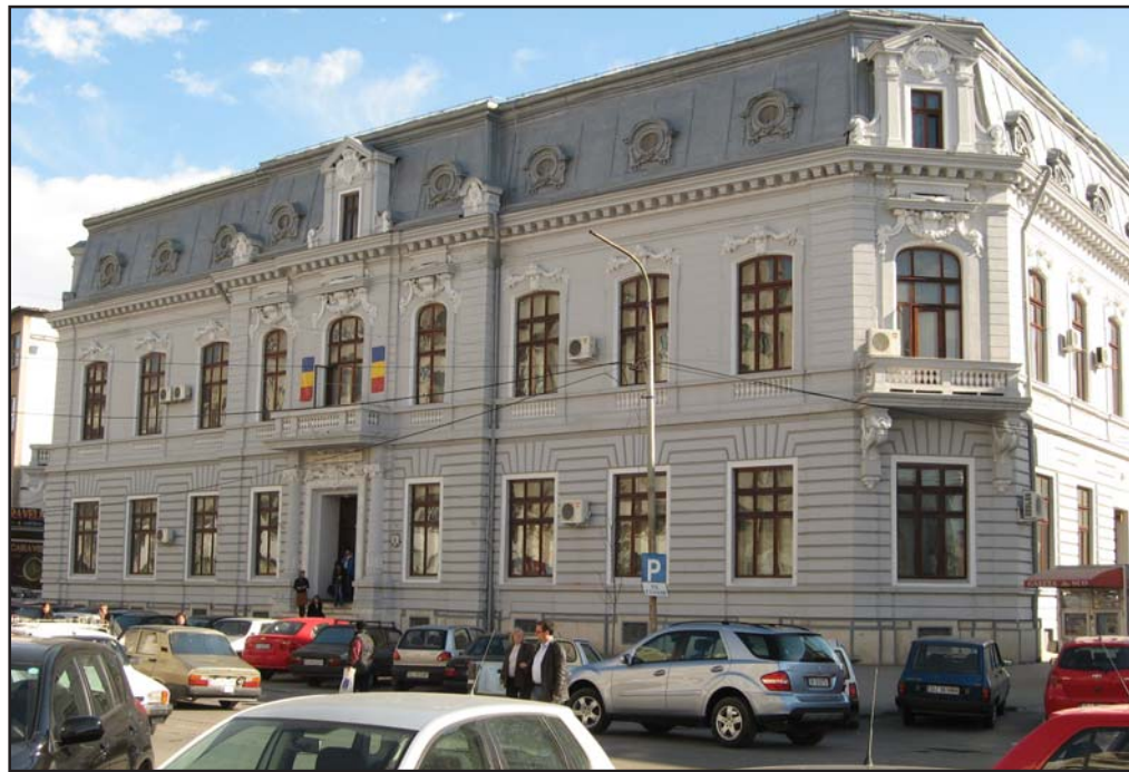
Curtea de Apel Craiova.