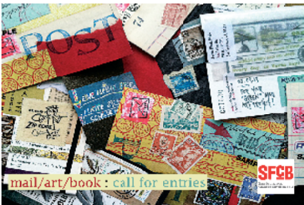
mail/art/book: call for entries

«„Mail art” este o mișcare artistică populară, care s-a centrat pe obiectivul de a trimite lucrări artistice prin intermediul poștei. Inițial, curentul s-a dezvoltat din mișcarea Fluxus, în anii 1950-1960. Foarte repede s-a transformat într-o mișcare globală, care continuă și azi. Artistul american Ray Johnson este considerat primul artist de e-mail, iar corespondența School din New York, care a dezvoltat acest curent, este considerată prima rețea conștientă de artiști e-mail. Ion Țuculescu, pictor craiovean, ce a folosit în pictura sa multe simboluri și motive preluate de pe scoarțele olteneste, este aniversat în luna mai și de aceea propunem ca titlul concursului să fie „Ion Țuculescu – sursă de inspirație pentru tineri”», au precizat reprezentanții bibliotecii doljene.