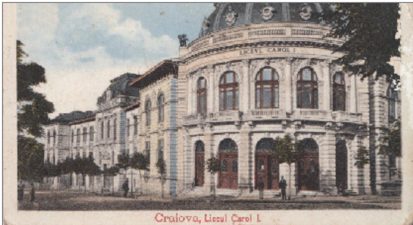
Craiova, Liceul Carol I

Astăzi, în cel de-al 188-lea an al Colegiului Național „Carol I” din Craiova, se întâlnesc – pentru a se revedea și a mai sta un pic la taclale – o parte din cei care au absolvit prestigioasa școală, cu 61 de ani în urmă. Cu toții au în jur de 80 de ani și, la emoția și bucuria revederii, cu siguranță o lacrimă le va stăruie în colț de gheană... Dintre cei care în 1953 absolveau cursurile liceale, mulți nu mai sunt acum printre ei, însă amintirea lor le-a rămas vie în suflete.