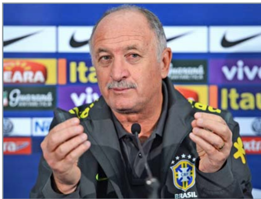
permite asta, însă în faza următoare nu mai este posibil, pentru că soarta

„Am reușit să ne calificăm, dar a fost dificil. Camerunul putea fi una dintre echipele implicate în lupta pentru calificare. După meciul lor din această seară, îți spui că nu este posibil ca această echipă să aibă trei înfrângeri în grupă. Noi suntem aproape de nivelul ideal și este important să ajungem la acest nivel în momentul meciurilor cu eliminare directă. Acum trebuie să comitem mai puține greșeli. În grupe îți poți