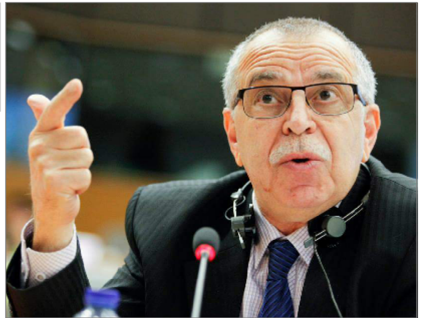
care a fost creat astăzi este periculos pentru toți cei care doresc o presă liberă, care nu poate fi in-

din dosarul ICA vine în contradicție cu o decizie a Curții Constituționale care precizează că un dosar constituit doar pe baza unei expertize DNA contravine dreptului la un proces echitabil, stabilit de Convenția Drepturilor Omului, susține deputatul european. „Fac un apel la organizațiile societății civile care monitorizează procesul de justiție din România să se aplece cu bună credință și asupra acestui caz. În egală măsură, fac un apel la jurnaliști, indiferent de opiniile lor, să urmărească și relateze într-un mod profesionist acest caz. Precedentul