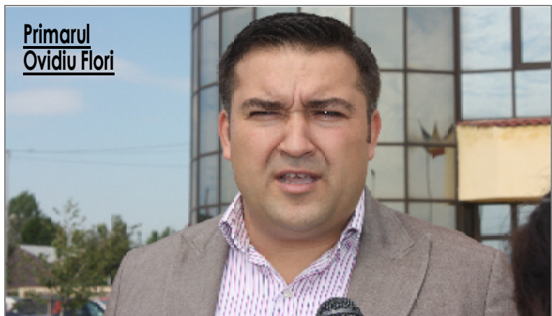
Primarul Ovidiu Flori