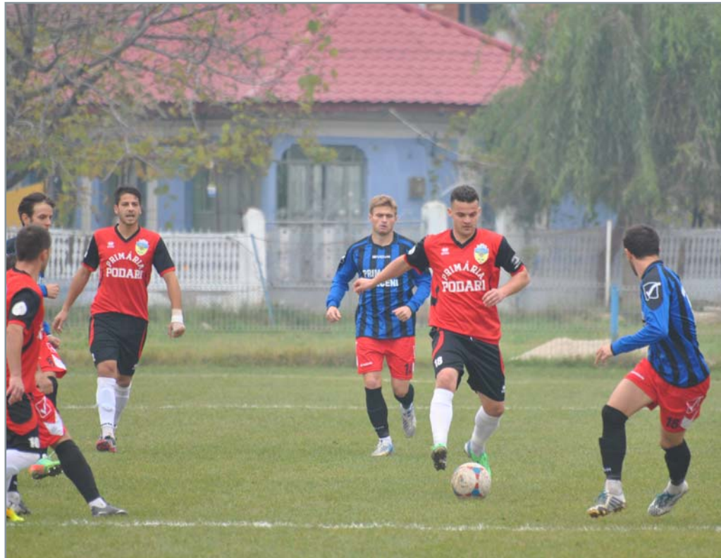
Muscel, cu echipa locală CN Dinicu Goleșcu.

Etapa viitoare, podărenii vor juca sâmbătă, de la ora 14:00, la Câmpulung