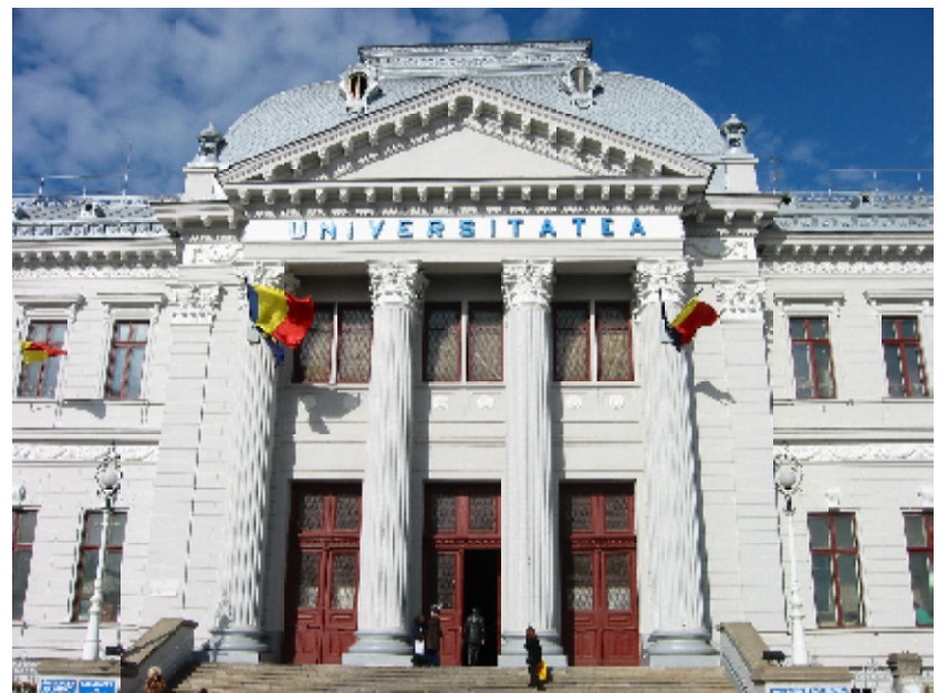
Proiectul prezentat de către studenții Universității din Craiova poate fi văzut în acțiune în data de 14-15 noiembrie a.c., în cadrul workshopului studentesc BringITon DE LA Iași.

venit cu noeme originale în ceea ce privește sistemele de securitate în hoteluri, prezentând un sistem care nu necesită utilizarea cheilor și întrerupătoarelor. Acest sistem, potrivit studenților, se instalează pe smartphone de către utilizator și îi facilitează controlul ușii, prizelor și luminilor de la distanță. În plus, cu ajutorul acestei aplicații, utilizatorii pot afla dacă este prezent cineva în încăpere. Echipelor finaliste li s-au alocat mentori tehnici și de imagine pentru îmbunătățirea modului de prezentare a proiectului. Concursul „ Informatics and Mathematics Students Moving Ahead