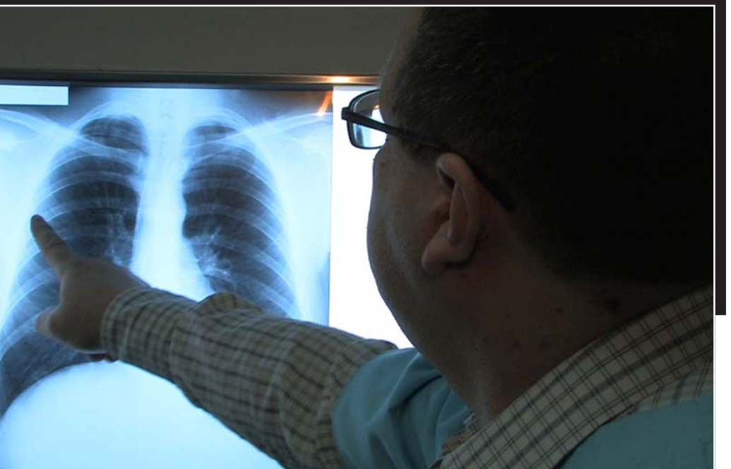
Un medic discutând cu un pacient despre rezultatele unei investigații medicale.

măsuri simple. Printre acestea, o alimentație variată și sănătoasă, menținerea greutății corporale normale, activitate fizică regulată, limitarea consumului de alcool, renunțarea la fumat și evitarea expunerii la fumat pasiv, evitarea expunerii excesive la soare și protejarea împotriva infecțiilor care