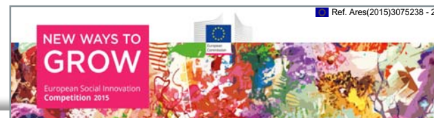
Overview of the 30 semi-finalists of the 2015 European Social Innovation Competition

Toate proiectele semifinaliste vor primi îndrumare și sprijin specializat pentru a le oferi o șansă reală în cadrul concursului, dar și dincolo de el. Astfel, cei care le-au propus vor participa, în perioada 7-9 septembrie, la “Academia de inovarea socială”, organizată la Viena, pentru a-și putea definitiva propunerile. Juriul va desemna, apoi, cei zece finaliști ai concursului. Cele mai eficiente trei soluții propuse vor primi o finanțare de 50.000 euro, fiecare, astfel încât ele să poată fi materializate. Ceremonia de premiere a câștigătorilor va avea loc în luna noiembrie, la Bruxelles. Propunerile selectate cuprind o gamă largă de idei ce merg de la transformarea deșeurilor alimentare provenite de la cantine și restaurante în biogaz, activitate ce creează locuri de muncă și ajută la diminuarea problemelor de mediu, și până la soluții pentru persoanele în scaun cu rotile sau cu mobilitate redusă care vor să lucreze în domeniul apiculturii.