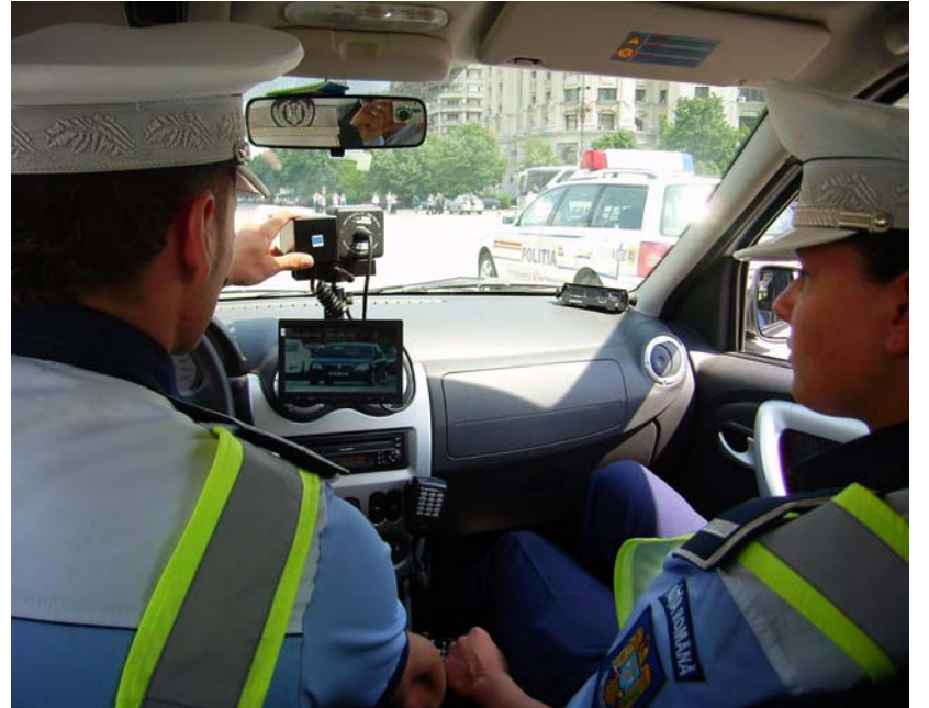
dreptului de a conduce autovehicule pe drumurile publice pentru o perioadă de 90 de

Pe parcursul acestor activități, polițiștii rutieri l-au depistat în trafic pe Ioan C., de 27 de ani, din Craiova în timp ce conducea un autoturism BMW, pe Calea Severinului din municipiul Craiova, cu viteza de 141 km/h. „Conducătorul auto a fost sancționat cu amendă contravențională, iar ca măsură complementară i-a fost reținut permisul de conducere în vederea suspendării