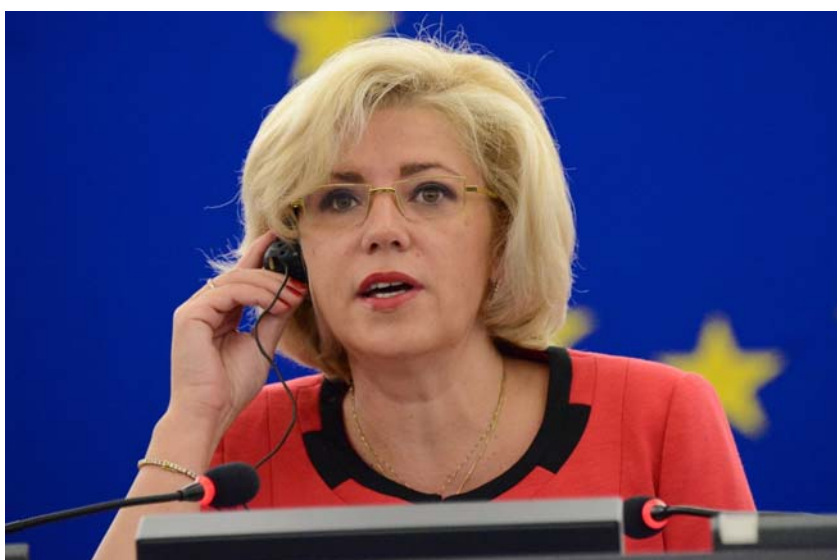
Ieri, comisarul european Corina Crețu a participat la conferința la nivel înalt care a marcat 25 de ani de program INTERREG, eveniment organizat în colaborare de președinția luxemburgheză a Consiliului Uniunii Europene și de Comisia Europeană.