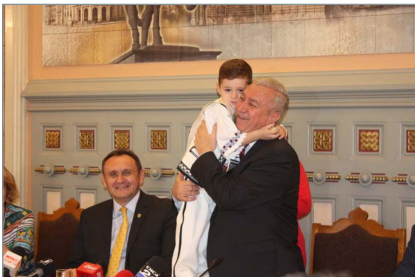
35 mii lei pentru marcarea zilei de 22 decembrie