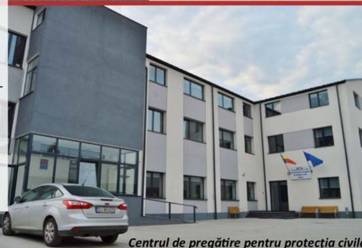
Centrul de pregătire pentru protecția civilă