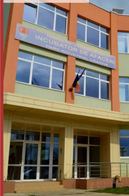
Parcul Industrial Craiova