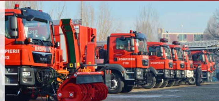
Autospeciale moderne pentru ISU Dolj