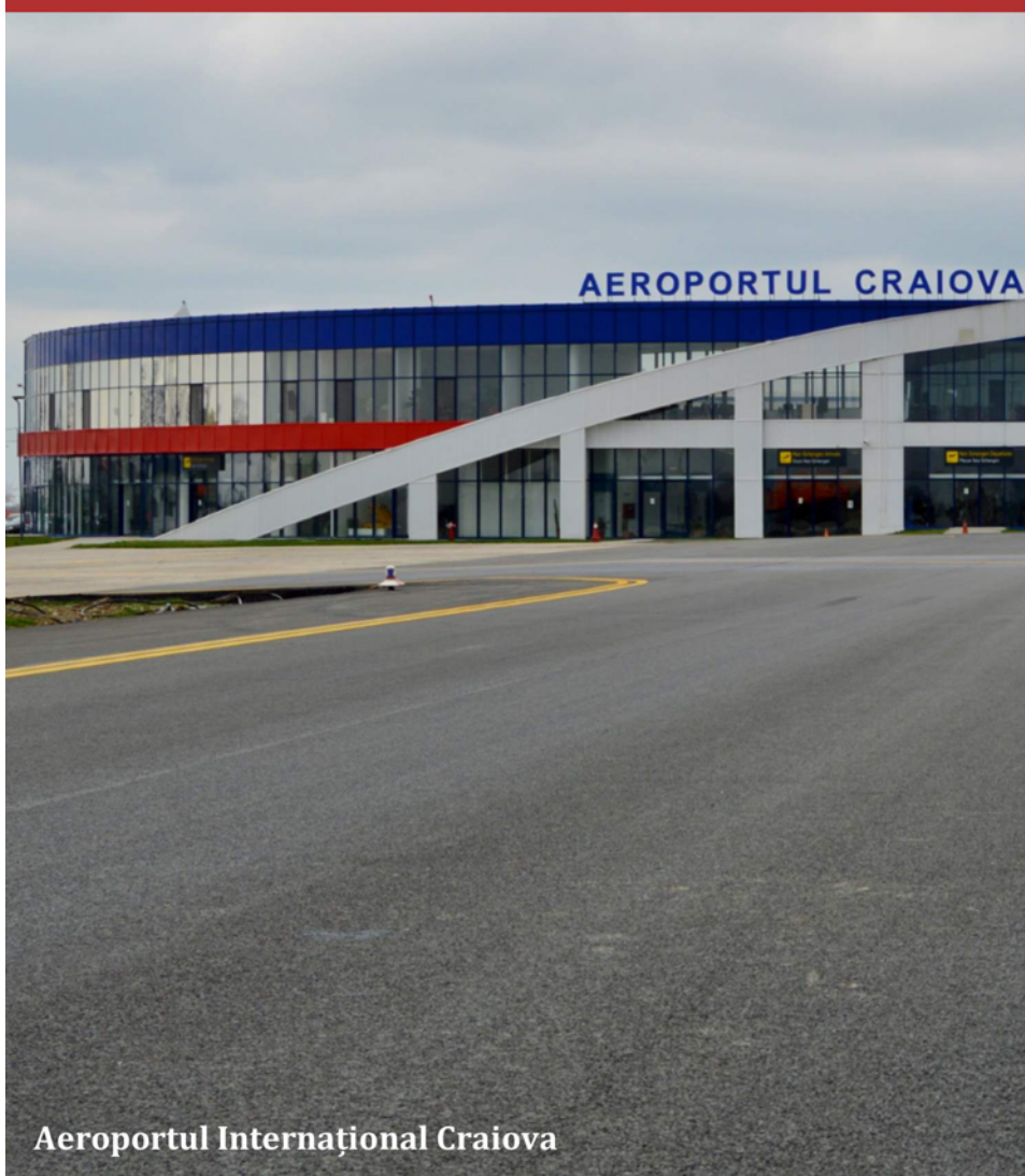
Aeroportul Internațional Craiova