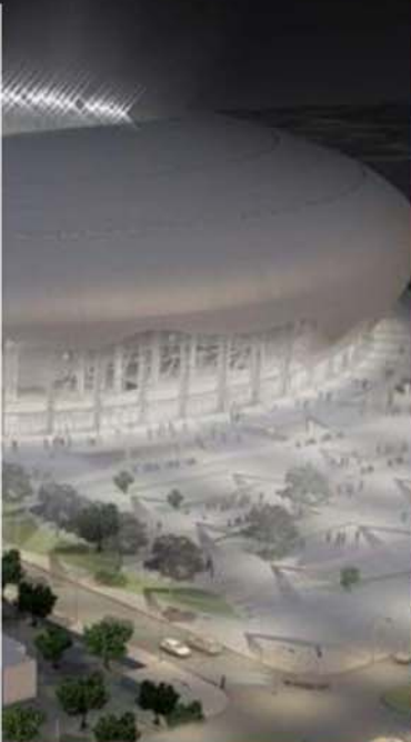
Liceul „George Bibescu”