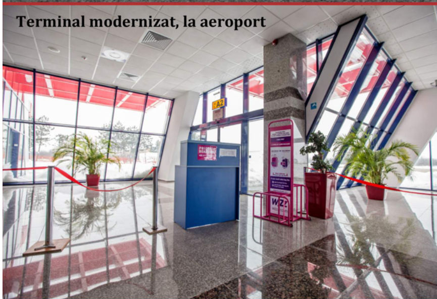
Terminal modernizat, la aeroport