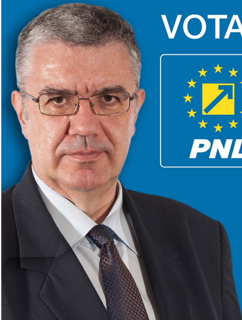
GIUGEA NICOLAE PREȘEDINTE DESEMNAȚ PENTRU C.J. DOLJ