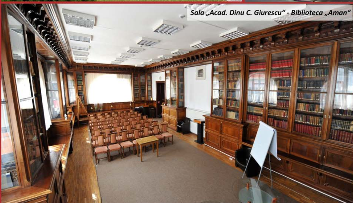
Sala „Acad. Dinu C. Giurescu” - Biblioteca „Aman”