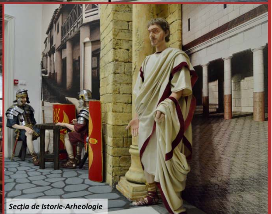
Secția de Istorie-Arheologie