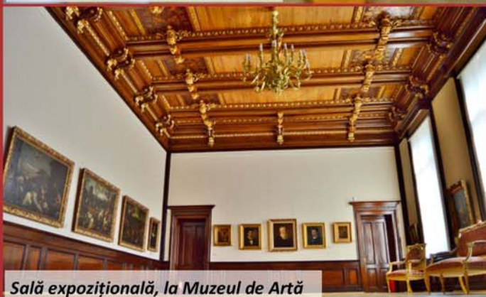
Sală expozițională, la Muzeul de Artă