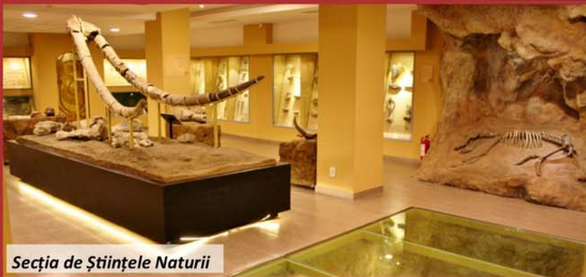
Secția de Științele Naturii