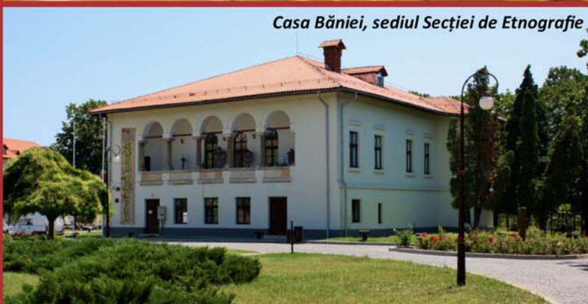
Casa Băniei, sediul Secției de Etnografie