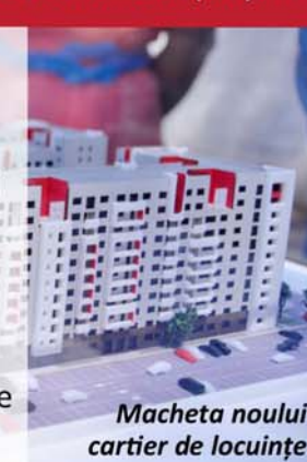
Macheta noului cartier de locuințe