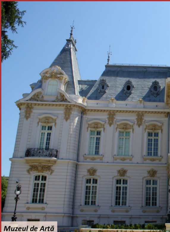
Muzeul de Artă