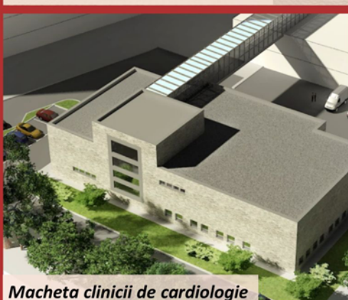
Macheta clinicii de cardiologie