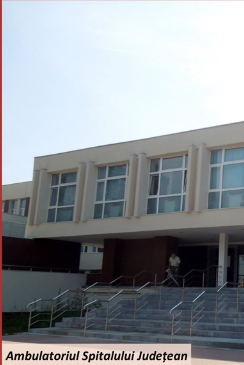
Ambulatoriul Spitalului Județean