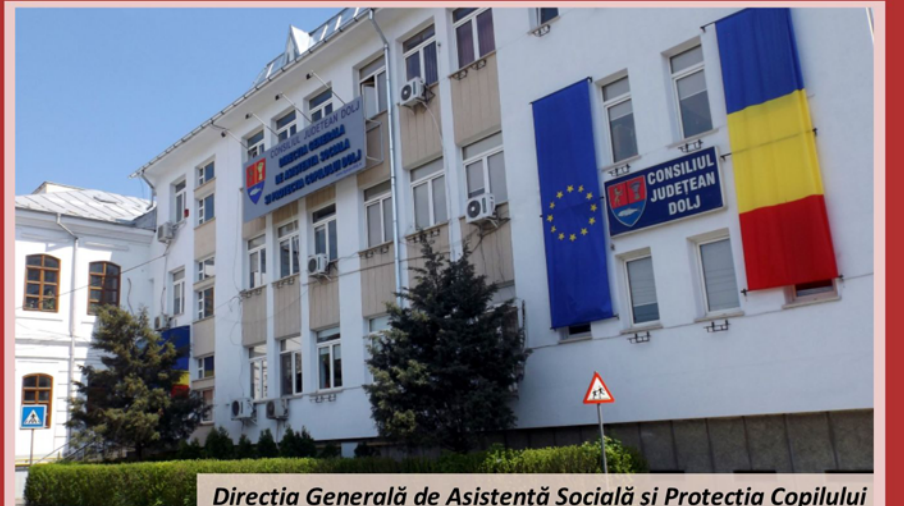
Direcția Generală de Asistență Socială și Protecția Copilului