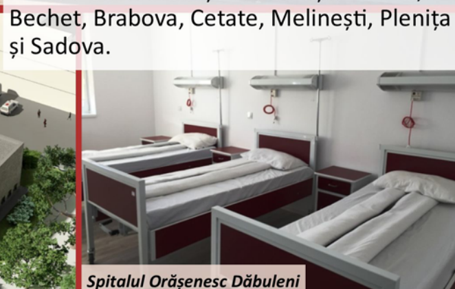
Spitalul Orășenesc Dăbuleni