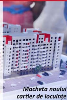
Macheta noului cartier de locuințe