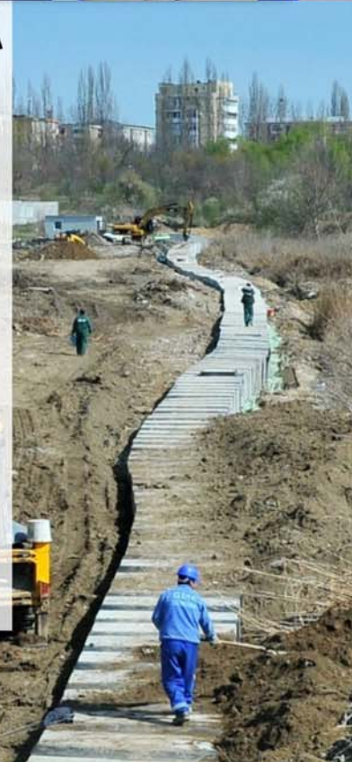
Casetarea canalului Cornițoiu