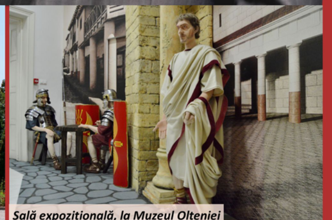
Sală expozițională, la Muzeul Olteniei