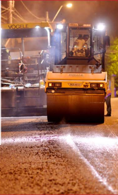
Bulevardul Carol I