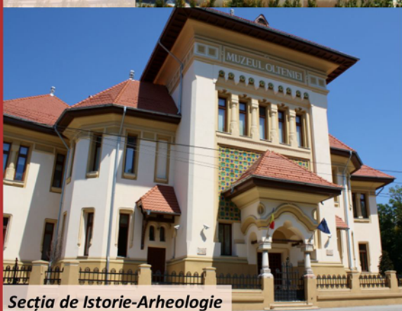
Secția de Istorie-Arheologie