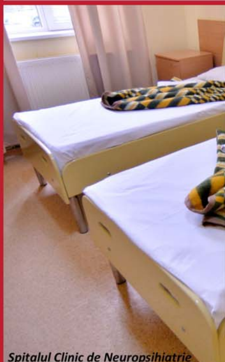
Spitalul Clinic de Neuropsihiatrie