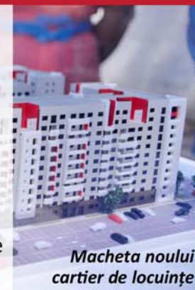
Macheta noului cartier de locuințe