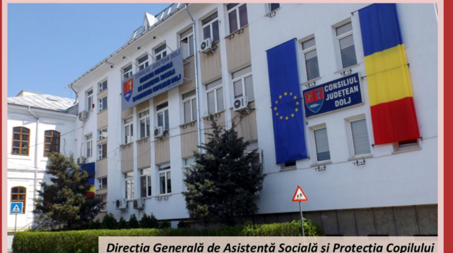
Direcția Generală de Asistență Socială și Protecția Copilului