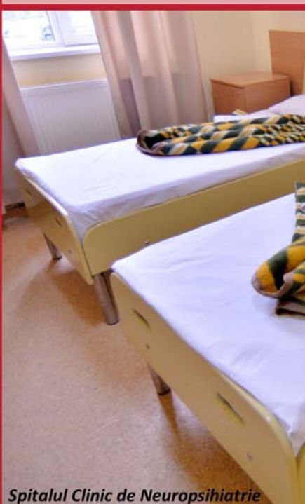
Spitalul Clinic de Neuropsihiatrie