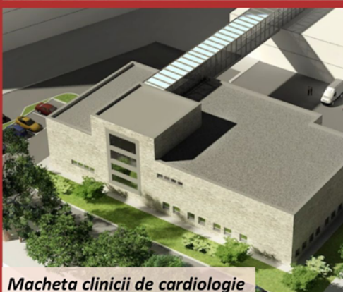
Macheta clinicii de cardiologie