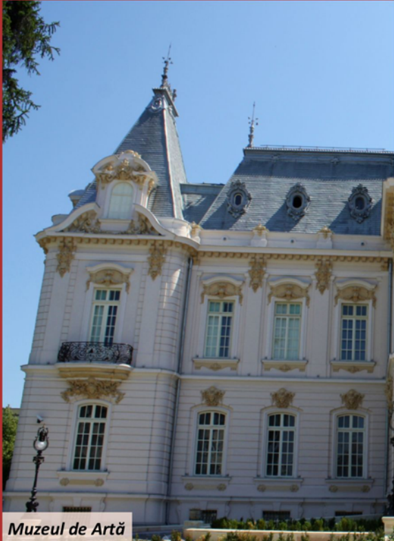
Muzeul de Artă