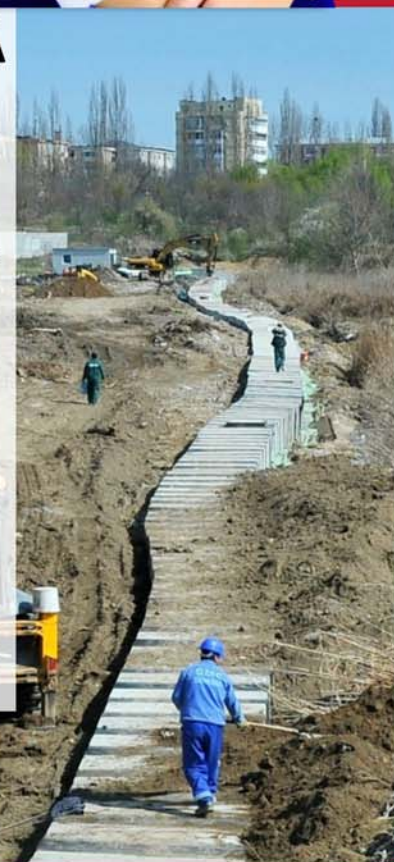
Casetarea canalului Cornițoiu