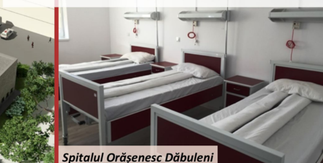
Spitalul Orășenesc Dăbuleni