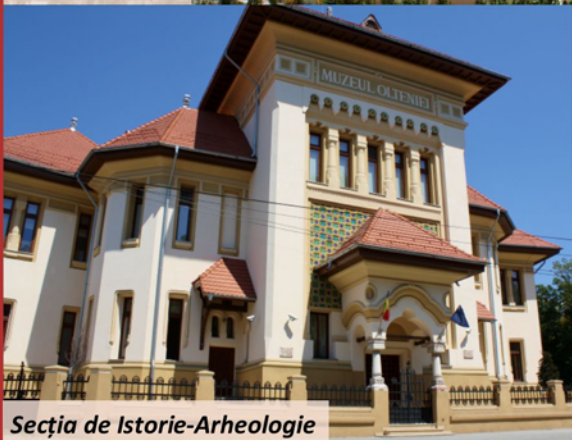
Secția de Istorie-Arheologie