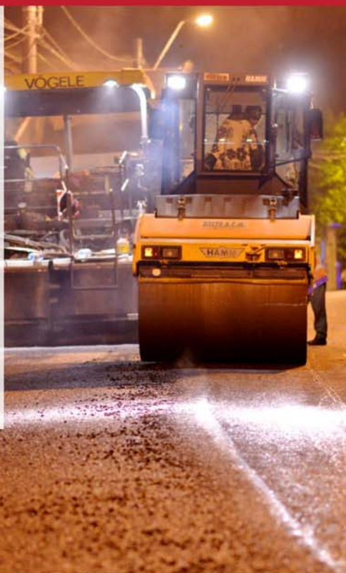
Bulevardul Carol I