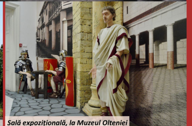
Sală expozițională, la Muzeul Olteniei