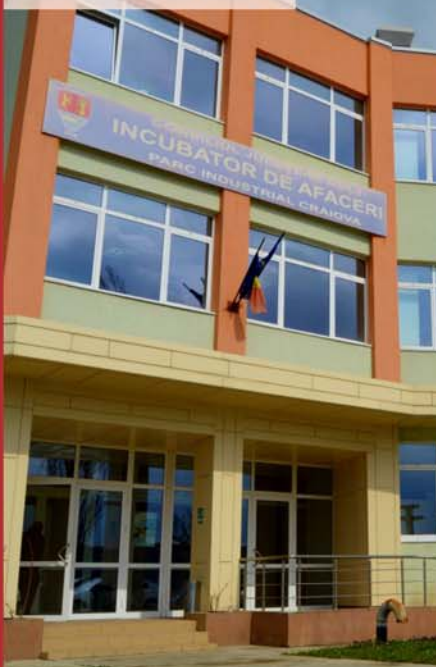
Parcul Industrial Craiova