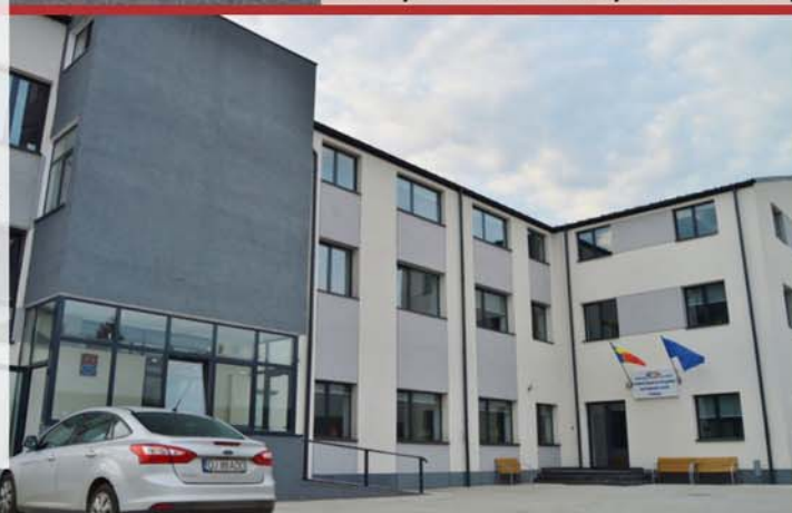
Centrul de pregătire pentru protecția civilă