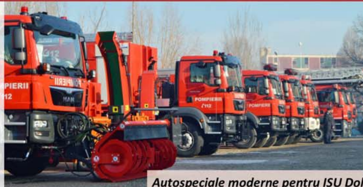
Autospeciale moderne pentru ISU Dolj