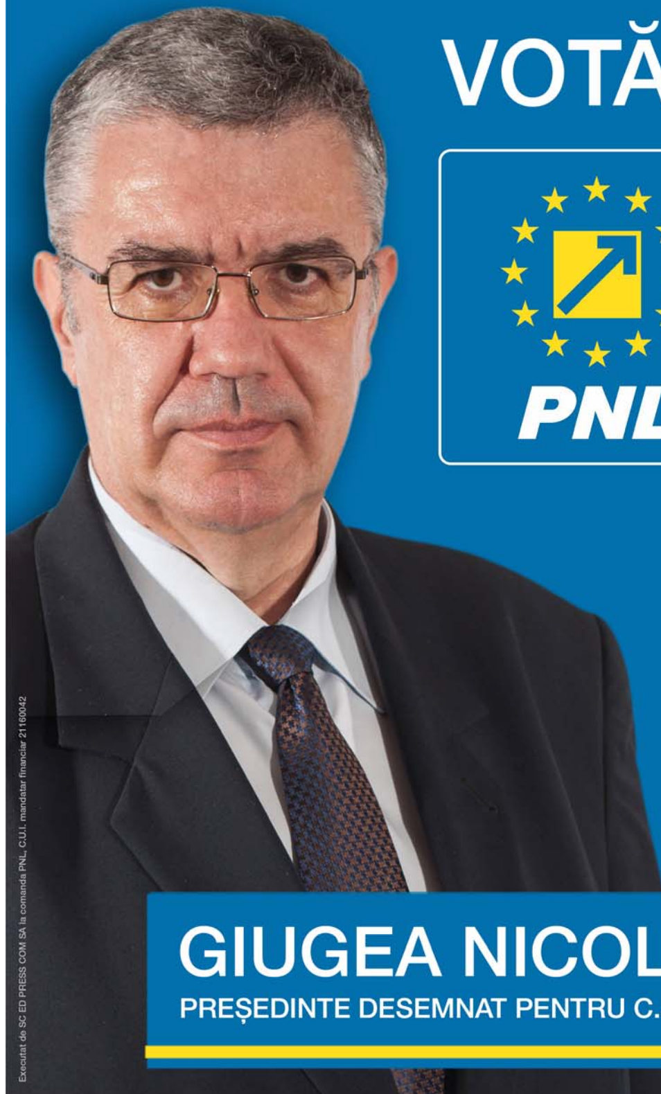
GIUGEA NICOLAE PREȘEDINTE DESEMNAȚ PENTRU C.J. DOLJ