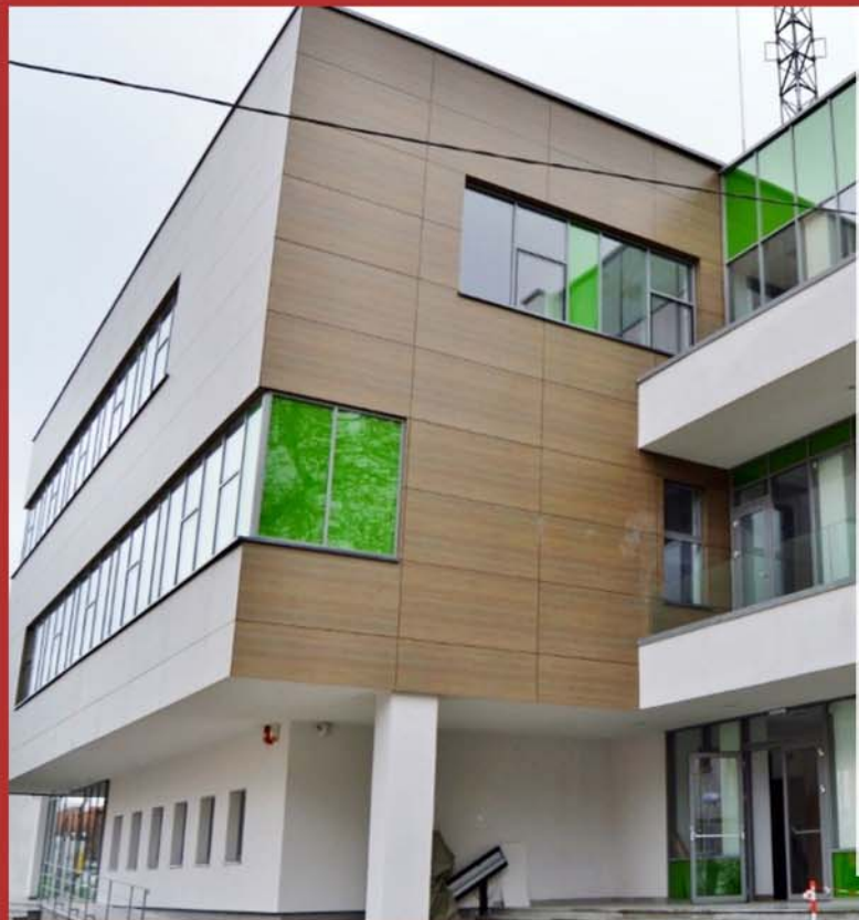
Centrul de coordonare a intervențiilor