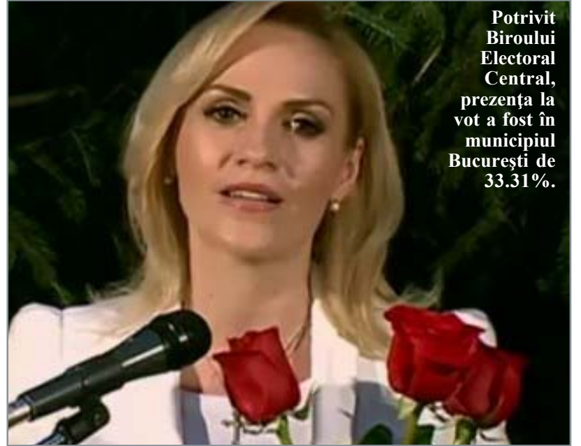
Potrivit Biroului Electoral Central, prezența la vot a fost în municipiul București de 33.31%.

Predoiu a declarat, aseară, după închiderea secțiilor de votare, că o