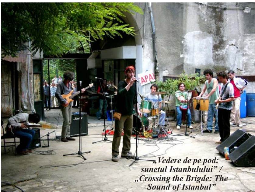
„ Vedere de pe pod: sunetul Istanbulului ” / „ Crossing the Brigde: The Sound of Istanbul ”

Potrivit organizatorilor evenimentului, cu filmul de deschidere, „ Moarte în Sarajevo ” (Serbia, 2016), „celebrul regizor bosniac deținător al unui Oscar, Denis Tanovic, prezintă o alegorie a Europei contemporane prin intermediul poveștii hotelului Europa, un loc plin de anarhiști, politrucci, cartofori, muncitori, demnitari și multe alte personaje ale societății moderne. La baza scenariului se află una dintre piesele de teatru ale celebrului activist politic Bernard-Henri Lévy”.