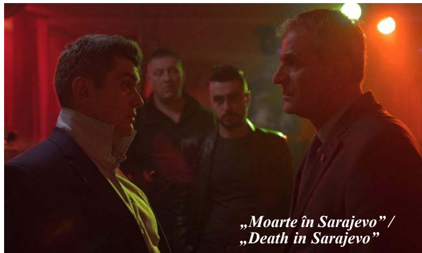
„ Moarte în Sarajevo ” / „ Death in Sarajevo ”