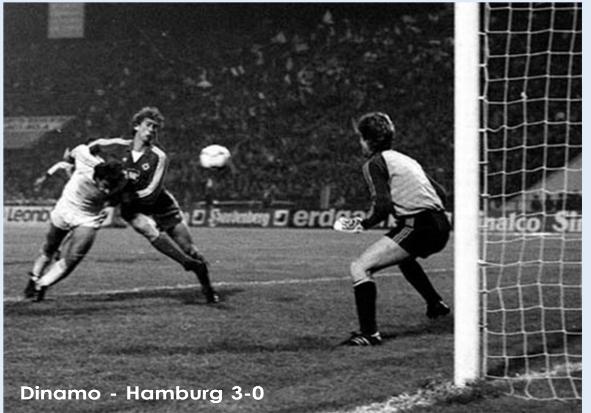
Dinamo - Hamburg 3-0