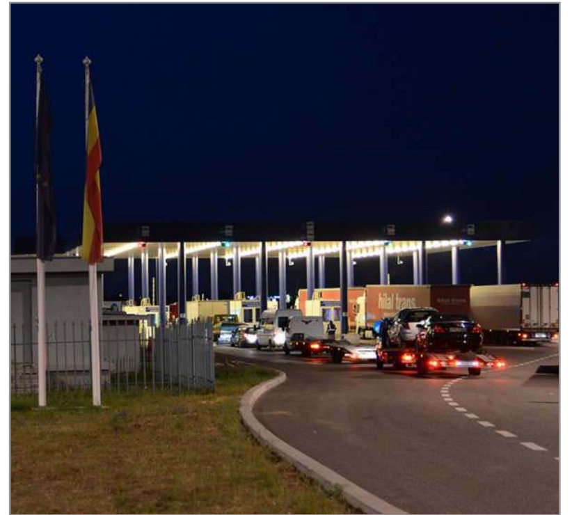
au fost predați Poliției de Frontieră Bulgare, în vederea continuării cercetărilor și dispunerii măsurilor

„Polițiștii de frontieră au procedat la întreruperea călătoriei persoanelor în cauză, iar conform protocolului româno-bulgar, conducătorul automarfarului, mijlocul de transport și cei doi cetățeni sirieni