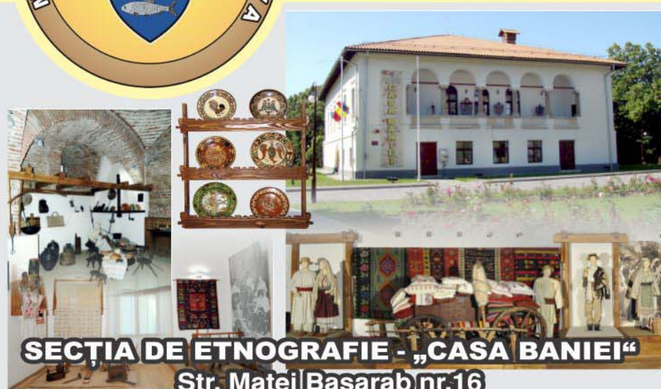
SECȚIA DE ETNOGRAFIE - „CASA BANIEI“ Str. Matei Basarab nr.16