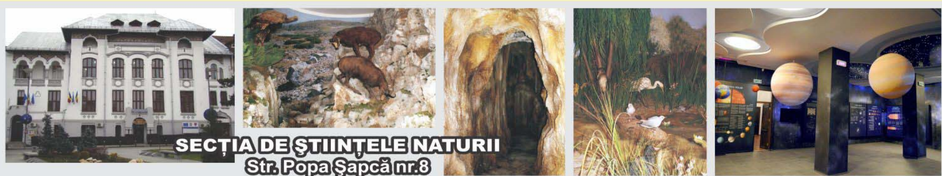
SECȚIA DE ȘTIINȚELE NATURII Str. Popa Șapcă nr.8

Contact: Str. Popa Șapcă nr.8 • Tel.: 0251-417.756 • muzeulolteniei@yahoo.com • www.muzeulolteniei.ro