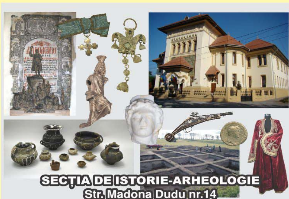
SECȚIA DE ISTORIE-ARHEOLOGIE Str. Madona Dudu nr.14