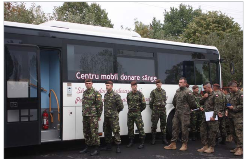
Laborator mobil, personal specializat și mulți voluntari