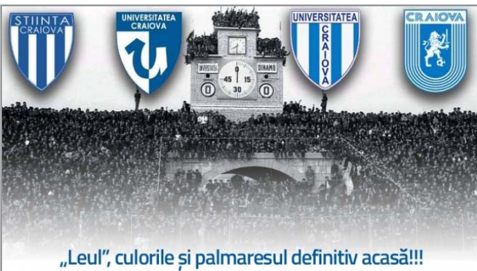
„Leul”, culorile și palmaresul definitiv acasă!!!

că abuziv numele și însemnele Științei, iar la finalul campionatului în curs va fi schimbat numele și la LPF și FRF, cel mai probabil urmând să se numească CS FC Universitatea Craiova.