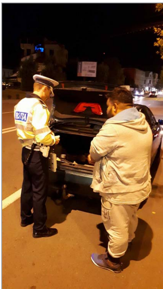
Reprezentanții Inspectoratului de Poliție al Județului (IPJ) Dolj au anunțat că, în noaptea de sâmbătă

100 de baruri și discoteci, polițiștii doljeni au oprit în trafic pentru controlul 820 de autovehicule, în total fiind aplicate amenzi în valoare de peste 70.000 lei. În plus, s-au întocmit și 16 dosare penale pentru infracțiunile constatate.