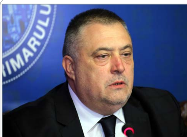
Mihail Genoiu, primarul municipiului Craiova:

Facultatea de Științe Sociale: 2 octombrie 2017, ora 13 00 , sala 444, clădirea Rectorat.